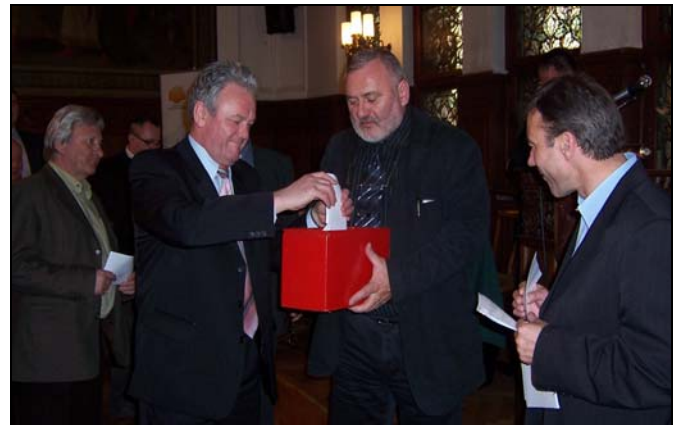
Wybory nowych władz SIPH