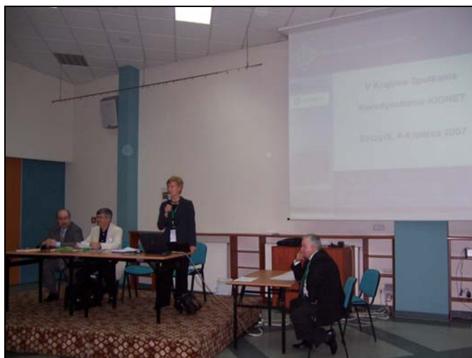
V Krajowe Spotkanie Koordynatorów Projektu KIGNET w Szczyrku