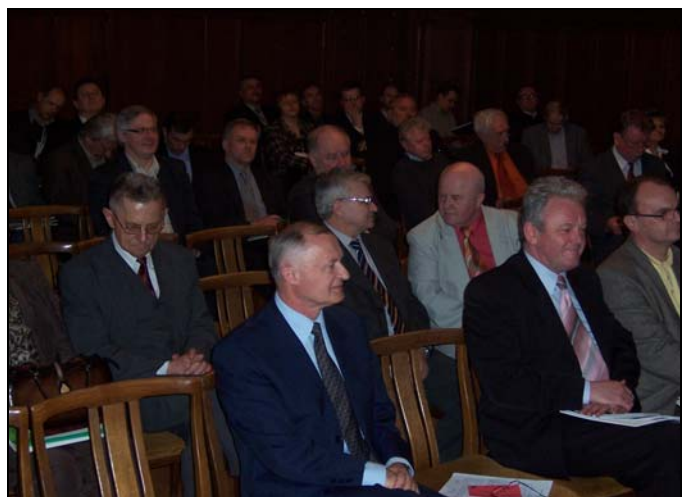
Sprawozdawczo-Wyborcze Walne Zgromadzenie Członków SIPH