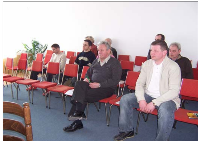
Seminarium współorganizowane z PIP w Słupsku, poświęcone wiosennemu przeglądowi budów i prawu budowlanemu