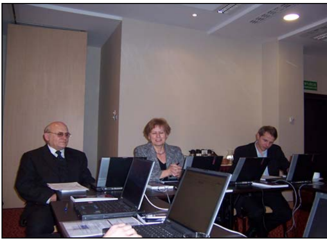
Szkolenie w Kielcach „Biznes Plan – zasady konstrukcji”