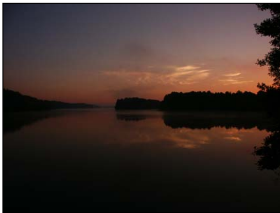
Zachód słońca nad jeziorem

Ważnym elementem krajobrazu Parku są jeziora o różnej wielkości, kształcie i pochodzeniu. Wśród jezior do najcenniejszych przyrodniczo należą jeziora lobeliowe z reliktową roślinnością oraz największe jezioro Parku Jasień (590 ha).