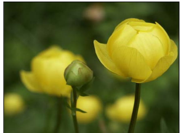
Kwiaty chronionego pełnika europejskiego

Flora roślin naczyniowych Parku liczy 748 gatunków, z czego wiele z nich to gatunki chronione, cenne, rzadkie i ginące.