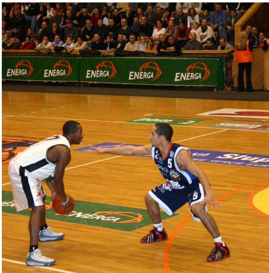
Czarni mają teraz wsparcie sponsorskie. Energa pozwala na budowę solidnego zespołu.