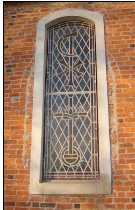
Witraże okienne z XIX wiek