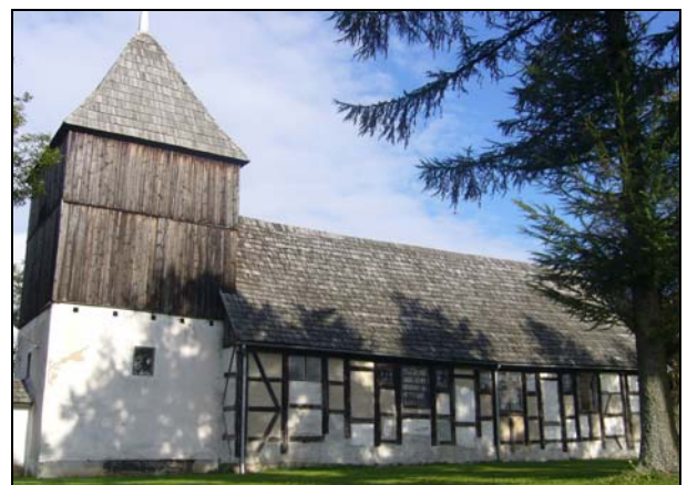
Szachulcowa konstrukcja kościoła w Dobieszewie

Wieża kościelna ma kształt kwadratu. W części dolnej jest otynkowana, a szczyt wieży stanowi oryginalna dobrze