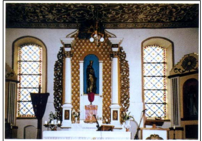
Zabytkowy ołtarz kościoła