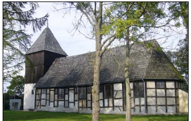
Szachulcowa konstrukcja kościoła w Dobieszewie

Kościół jest budowlą jednonawową o typowej konstrukcji szachulcowej osadzoną na kamiennym fundamencie. Budownictwo szachulcowe, zwane również budownictwem ryglowym lub „pruskim murem”, to jeden z najstarszych sposobów budowy domów na Pomorzu. Charakteryzuje się tym, że czarne drewniane belki konstrukcyjne budynku wypełniane były białą gliną (to jedna na najprymitywniejszych metod konstrukcji tzw. „pruskiego muru”) lub ceglami.