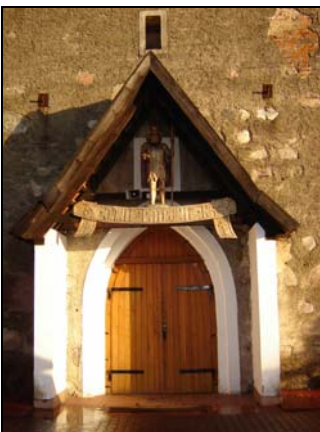
Święty Jan Chrzciciel jest patronem kościoła

W latach 1781-1786 kościół został rozbudowany. Dobudowano wówczas wschodnią część kościoła o konstrukcji szachulcowej, obejmującą transept i prezbiterium. W latach 90-tych XX wieku dokonano kolejnej przebudowy kościoła, rozbudowując część wschodnią. Wejście do świątyni zdobi figurka Św. Jana Czciela - patrona kościoła.