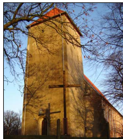
Wieża kościelna wybudowana została dopiero w XVII wieku

Wieża kościelna wybudowana została w XVII wieku. Do XIX wieku była zwieńczona wysokim ośmiobocznym dachem, który po zniszczeniu przez pożar w 1815 roku zastąpiony został dachem niskim, ostrospadowym.