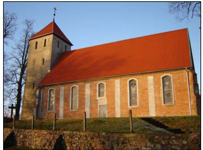
Najstarszy XIV-wieczny kościół w Budowie

Podróż śladem zabytków sakralnych gminy Dębica Kaszubska kończymy w miejscowości Budowo. Zdobiąca centrum wsi świątynia jest typowym kościołem w stylu gotyckim. Wzniesiono ją w pierwszej połowie XIV wieku jako prostą jednonawową budowlę. Jest to kolejny zabytkowy murowany kościół w gminie, osadzony na kamiennym fundamencie.