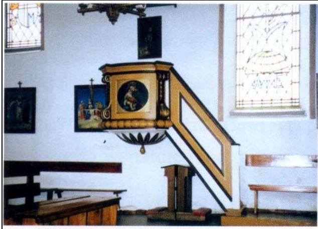
Zdobiona ambona z XVII wieku.

We wnętrzu kościoła na szczególną uwagę zasługuje bogato zdobiona ambona pochodząca z XVII wieku i oryginalny ołtarz z XVIII wieku. Typowego sakralnego charakteru dodają kościołowi wykonane w XIX wieku witraże, zdobiące okna budynku.