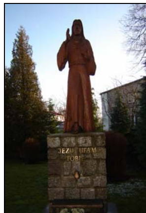
Postać Jezusa - nieopodal wejścia do kościoła