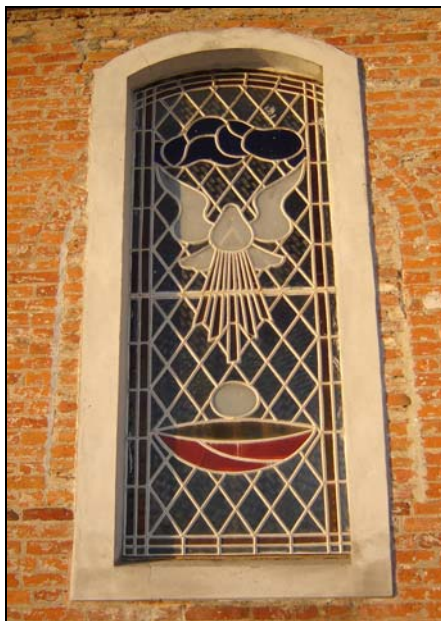
Witraże okienne z XIX wiek