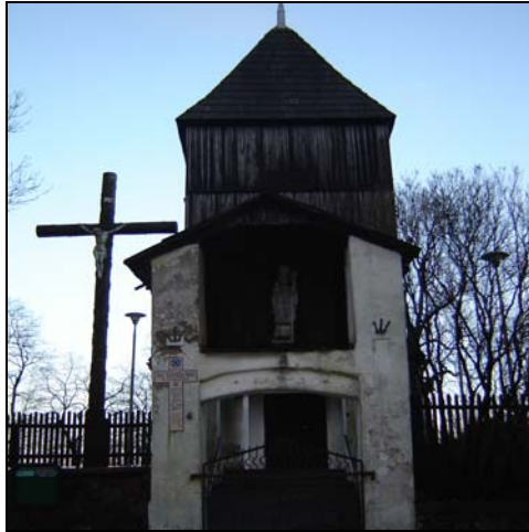
Drewniana wieża kościoła

zachowana drewniana konstrukcja. Wejście do kościoła zdoła maszynowy drewniany i bogato zdobiony krzyż z postacią ukrzyżowanego Chrystusa - dar parafian oraz figurka patrona kościoła - Św. Stanisława.