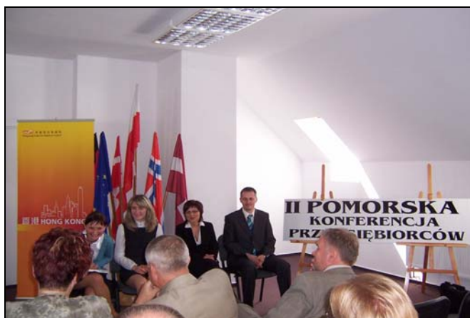
Pytania do prelegentów