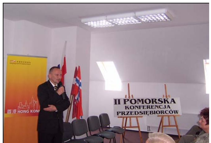
Wystąpienie Starosty Słupskiego Pana Sławomira Ziemianowicz