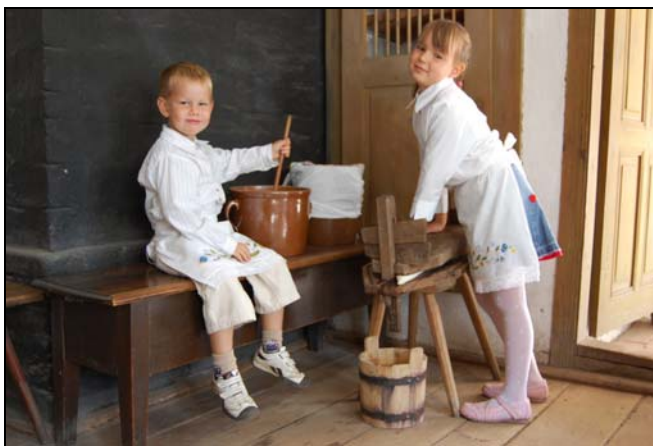
Próbujemy zrobić twaróg

Garncarz pomaga im wytoczyć garnek na kole, a rybak uszyć kleszczką kawałek sieci. W tym dniu dzieci mogą swobodnie podążać od zagrody do zagrody, brać udział w grach i zabawach terenowych, niegdyś popularnych na całym Pomorzu. Mogą sprawdzić swoją wiedzę o regionie, Słowińcach i muzealnych ekspozycjach uczestnicząc w konkursach. A zmęczone mogą przysiąść