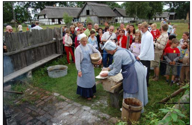
„Dni z muzyką i chlebem”

Zaproszony zespół bądź kapela ludowa prezentując muzykę, pieśni i tańce kaszubskie porywają do tańca i śpiewu, natomiast słowińskie gospodynie-pracownice Muzeum- pieką chleb według oryginalnej słowińskiej receptury, który można posmakować ze słowińskim smalcem. Jest przy tym możliwość obserwacji całego procesu pieczenia: od rozgrzewania ceglanego pieca po włożenie do niego uformowanych bochnów. Znajdzie się też coś na słodko: drożdżowe, smażone w żeliwnej wafelnicy serca, posypane cukrem.