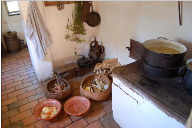
Gotujemy zupę z brukwi „Jesień się pyta co lato zrobiło”

niedziele września) „Pożegnanie lata w skansenie. Jesień się pyta co lato zrobiło”. Jesienna obfitość, radość z plonów i przygotowywanie zapasów na zimę, było inspiracją do zorganizowania tej imprezy. Najsmaczniejszą i wzbudzającą najwięcej emocji częścią imprezy jest prezentacja dawnej kuchni - prostej, aczkolwiek często zaskakującej współczesnego konsumenta. Tradycyjnie pieczony jest słowiński chleb, robiony smalec, masło i twaróg, drożdżowe wafle.