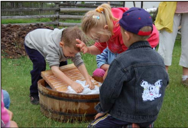
Festyn dziecięcy

Kolejną okazją do odwiedzenia MWS w Klukach jest impreza plenerowa organizowana z okazji Dnia Dziecka. Każdego roku 1 czerwca organizujemy „Festyn Dziecięcy”, podczas którego dzieci mają szansę zapoznać się z codziennymi obowiązkami i zabawami swoich rówieśników, mieszkających niegdyś na pomorskich wsiach. Pod okiem pracowników skansenu mogą pracować i maglować, tkąć na krosnach i prząść nici na kołowrotku.