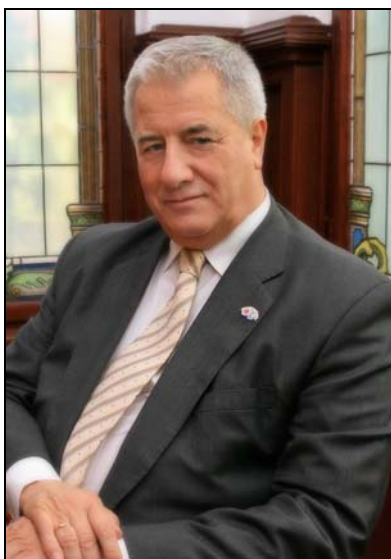
Prezydent Miasta Słupska Pan Maciej Kobyliński

Związek Powiatów Polskich to stowarzyszenie powiatów działające w dwudziestolecie międzywojennym, mające za zadanie obronę ich wspólnych interesów. Reaktywowane zostało (z inicjatywy samorządowców powiatów i miast na prawach powiatów) w dniach 26 i 27 lutego 1999 roku w Nowym Sączu. Obecnie ZPP skupia 321 powiatów i miast na prawach powiatów. W Polsce istnieje 379 powiatów, w tym 65 to miasta na prawach powiatu (powiaty grodzkie), a 314 to powiaty (powiaty ziemskie).