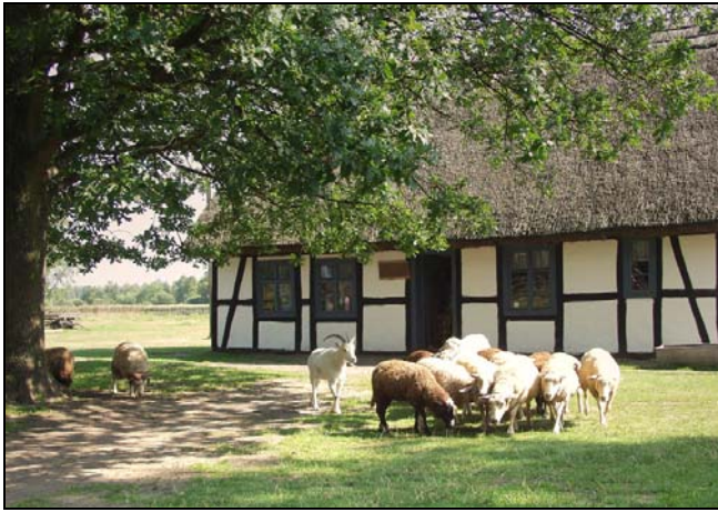
Chałupa Alberta Klucka

Muzeum Wsi Słowińskiej w Klukach jest miejscem unikalnym. Powstało z myślą ratowania kultury materialnej dawnej ludności kaszubskiej - Słowińców, która w XIX wieku zamieszkiwała tereny położone w okolicach jeziora Gardno i Łebsko. Na terenie słowińskim Kluki były wsią, w której najdłużej utrzymywały się relikty kultury materialnej i tradycje słowińskie. Dlatego też w 1963 roku powstała tu zagroda muzealna, która w ciągu 46 lat istnienia rozbudowała się w Muzeum Wsi Słowińskiej, prezentujące budownictwo słowińskie od końca XVIII wieku po lata 30-te XX wieku oraz odtworzone wnętrza poszczególnych obiektów, (uwzględniając przy tym zmiany kulturowe i gospodarcze).