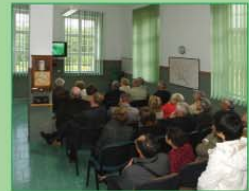
Sala historii w EW Gałąźnia