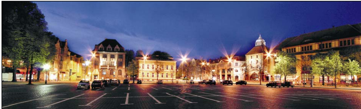
Słupsk, Plac Zwycięstwa

Partnerem merytorycznym Miasta Słupska w realizacji projektu jest Słupska Izba Przemysłowo-Handlowa.