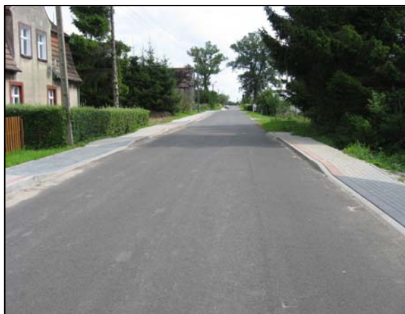
Zdjęcie 4. Chodniki i jezdnia w miejscowości Gałęzinowo

Wartość obu zrealizowanych inwestycji zamknęła się kwotą 8.843.653 zł, w tym współfinansowanie z Regionalnego Programu Operacyjnego dla Województwa Pomorskiego na lata 2007-2013 wyniosło 5.860.687 zł, środki przeznaczone przez Powiat Słupski to 2.982.966 zł.