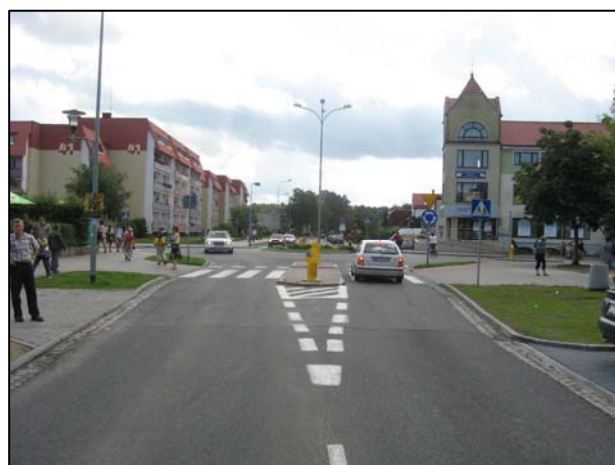
Zdjęcie 6. Ul. Grunwaldzka w Ustce- widok na rondo