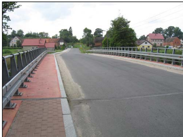
Zdjęcie 1. Most w Charnowie widok ogólny

Prowadzona przebudowa jako poważne przedsięwzięcie inżynierskie przyczyniła się do znacznej poprawy jakości komunikacji na drodze powiatowej 1110G. Zwiększona nośność i szerokość jezdni pozwalają na swobodny przejazd pojazdów zarówno osobowych, jak i ciężarowych.