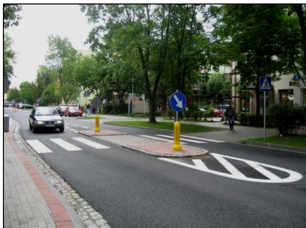
Zdjęcie 5. Przejście dla pieszych na ul. Grunwaldzkiej w Ustce

Przeprowadzony remont odcinka ul. Grunwaldzkiej w znakomity sposób poprawił warunki ruchu pieszego i samochodowego na ważnej dla miasta drodze prowadzącej do innych miejscowości nadmorskich.