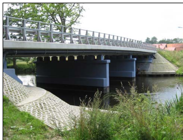
Zdjęcie 2. Most w Charnowie widok na przęsła i przyczółki