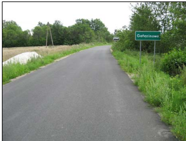
Zdjęcie 3. Wjazd do miejscowości Gałęzinowo

Przeprowadzony remont dróg pozwolił w sposób istotny podnieść walory estetyczne i komunikacyjne miejscowości Niestkowo, Charnowo, Gałęzinowo i Wielichowo, przyczyniając się też wraz z przebudowanym charnowskim mostem na Słupi do znacznie lepszego skomunikowania terenów miejscowości z drogą krajową nr 21 Słupsk – Ustka, która jest ważnym szlakiem komunikacyjnym dla mieszkańców regionu.