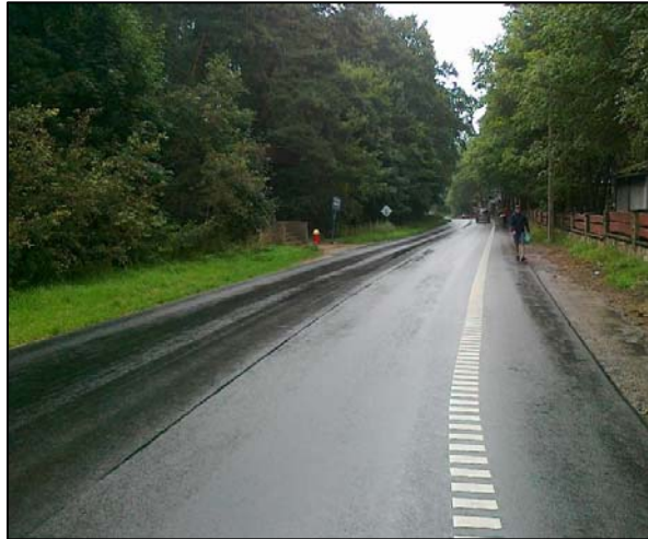
Zdjęcie 7. Ścieżka rowerowa w m. Dębina

W okresie od maja do lipca 2010 r. ZDP w Słupsku przebudował drogi powiatowe Gąbino - Objazda nr 1112G oraz Objazda - Rowy nr 1117G. Przeprowadzone prace remontowe polegały na wzmocnieniu konstrukcji nawierzchni poprzez wykonanie dwuwarstwowej nakładki bitumicznej, budowie chodników i zjazdów na posesje w miejscowościach Gąbino, Objazda, Bałamątek, Dębina oraz wykonaniu poszerzenia i ścieżki rowerowej na odcinku Dębina – Rowy.