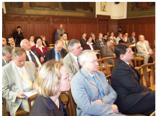
Uczestnicy forum dyskusyjnego, które zainaugurowało SDG 2006