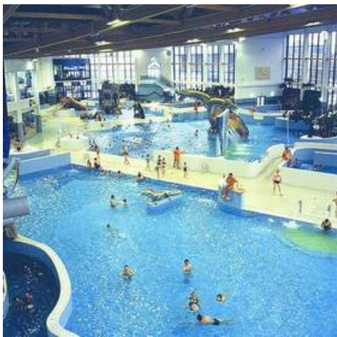
Tak wygląda park wodny w Krakowie.

Już tylko dwa konsorcja liczą się w konkursie na wybór partnera, z którym słupski samorząd zamierza budować park wodny przy ul. Grunwaldzkiej. Na początku lutego ma zapadnąć ostateczne rozstrzygnięcie.